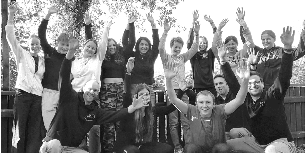
Die Teilnehmer des Schnupper-Trainerlehrgangs