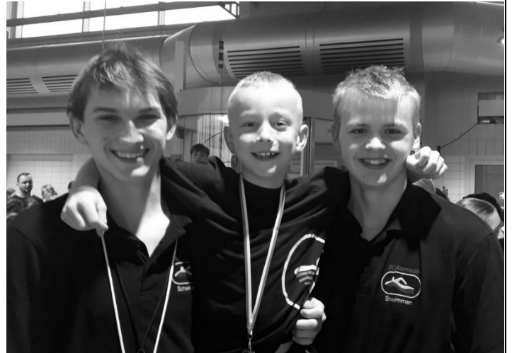
Stolzer Wettkämpfer am Fürther Kinderschwimmen